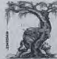
鲁智深倒拔垂杨柳