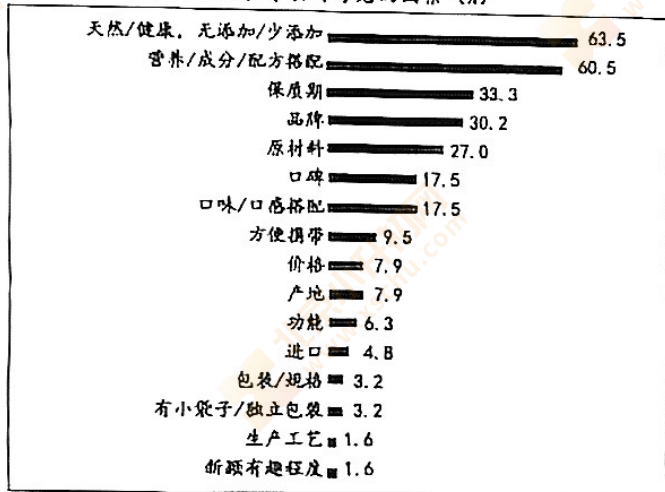
家长购买儿童零食时考虑的因素 (%)