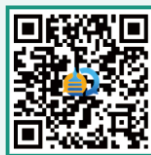
北京通州教育咨询