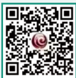
北京市通州区教委

您可以关注“北京市通州区教委”公众号或登录“北京通州教育咨询”平台 ( http://zxzx.bjtzeduyun.com/ )，查看入学相关政策。