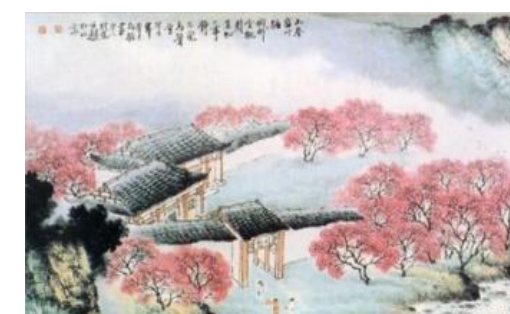
D ( )