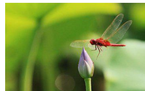
B ( )