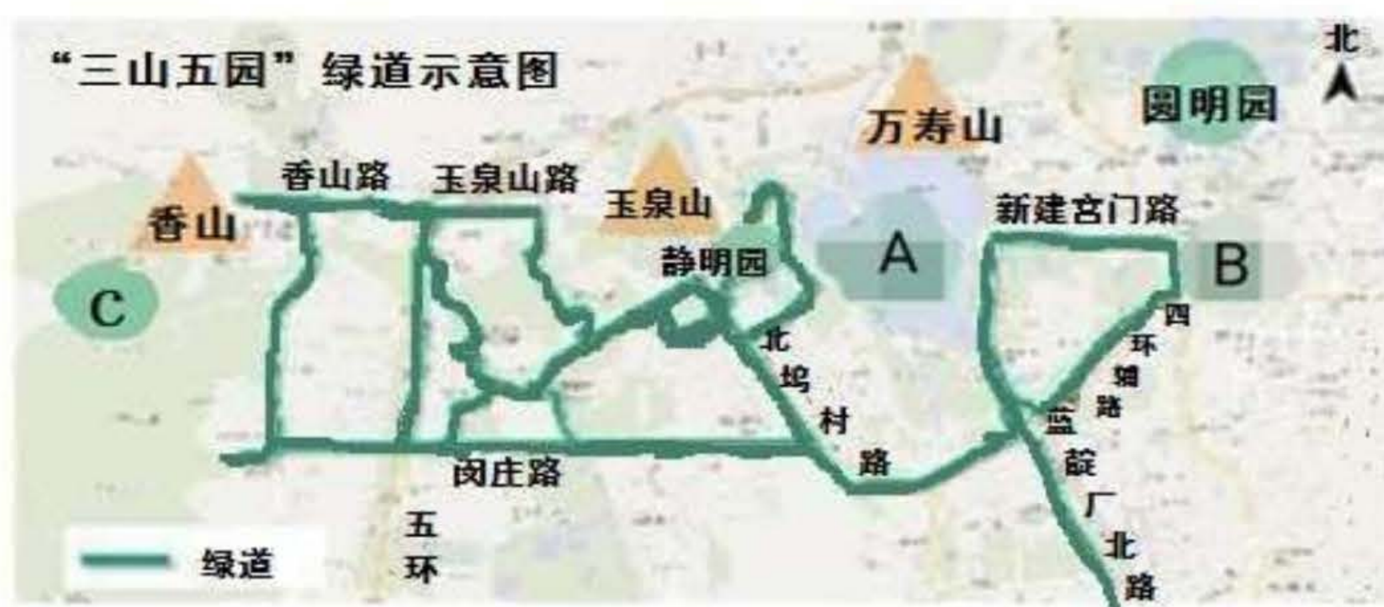
“三山五园”绿道示意图